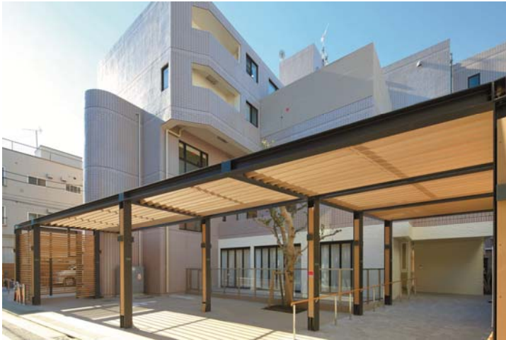
物件4：メディカルホームグランダ三軒茶屋（底地）